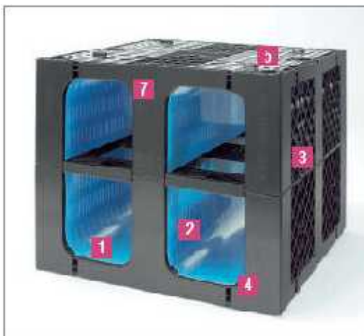
RAUSIKKO Box 8.6 SC