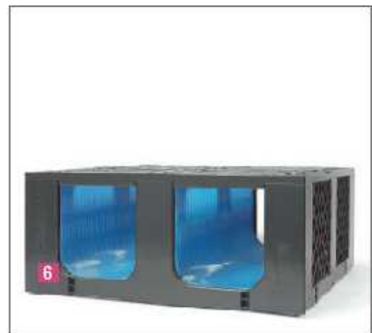
RAUSIKKO Box 8.3 SC