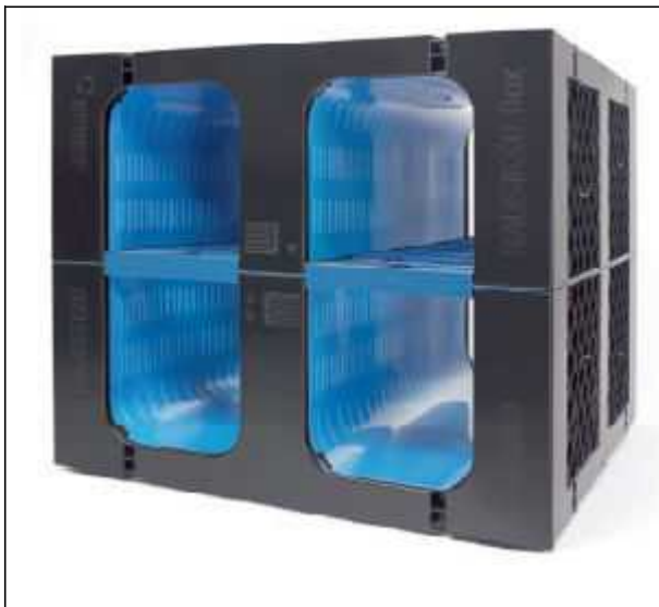
RAUSIKKO Box 8.6 C