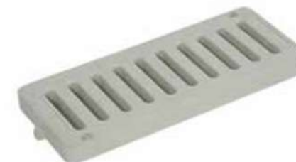
Комбинирана решетъчна решетка 20x50