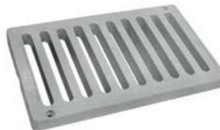
Комбинирана решетъчна решетка 30x50