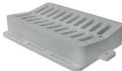
Композитен вдлъбнат решетъчен комплект 30x50