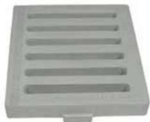
Комбинирана решетъчна решетка 40x45